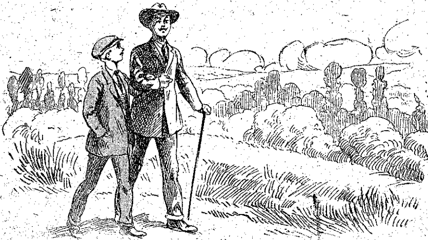
«Ξανάρχισαν ή ώρες έκδρομής...» (Σελ. 408 στ. 4.)

Έν τῷ μεταξύ, τὸ κτίσιμό του και τοῦ προχωρούσε και κατά τὰ τέλη του μηνός ο σκελετός ήταν σχεδόν τελειωμένος. Ο Πέγκροφ εργαζέτο με άπαράμιλλο ζήλο κ' έπρεπε να χῆ την σιδε-